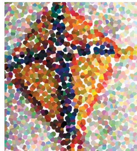
Illustration: del av stola Stockholms stift "samiska kretsen". Bearbetad bild. Britta Marakatt - Labba 2006